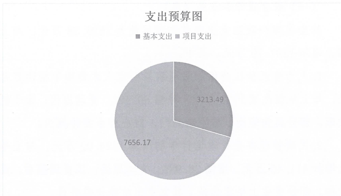
图 2. 支出预算图